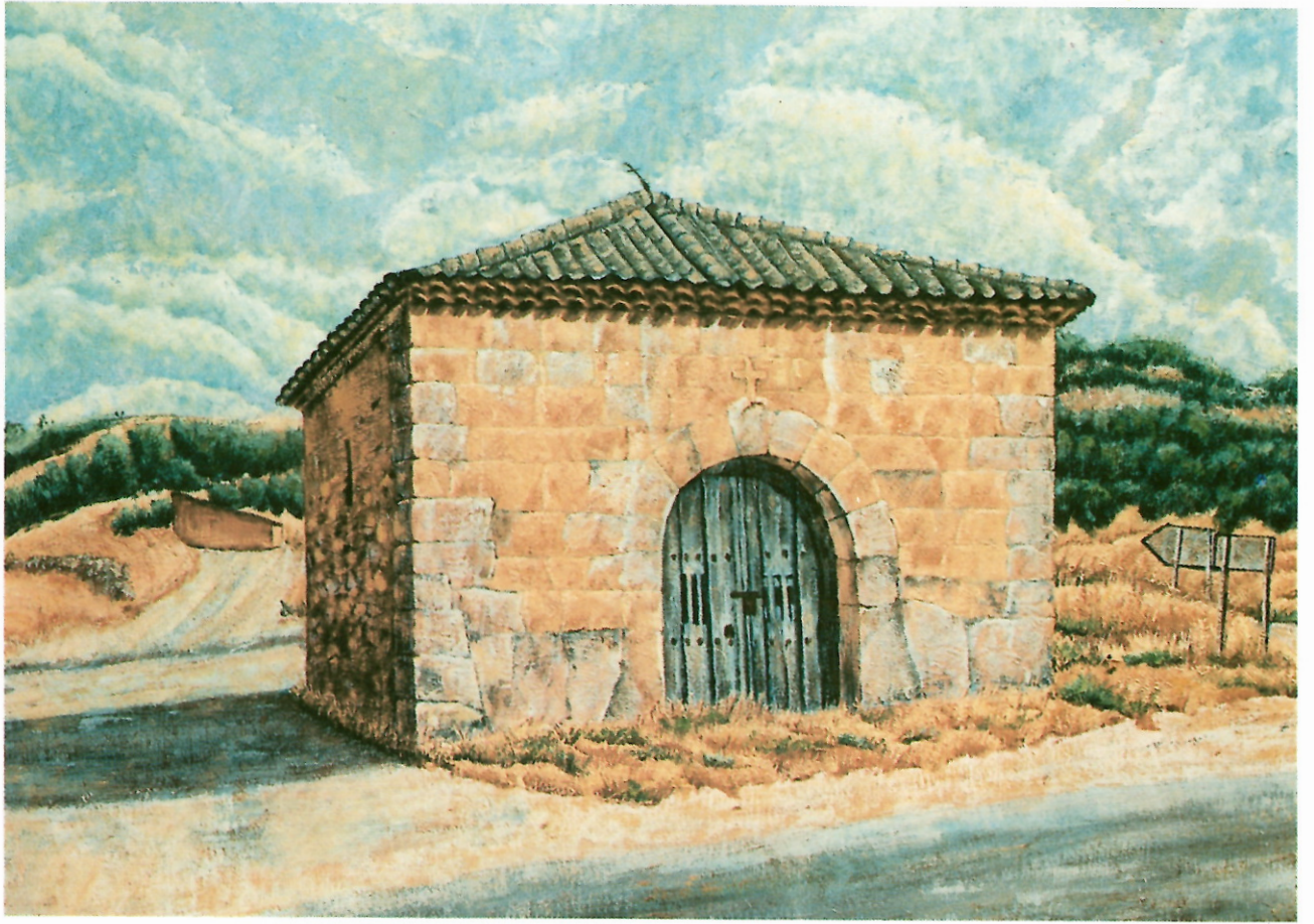
ERMITA DEL SANTO CRISTO