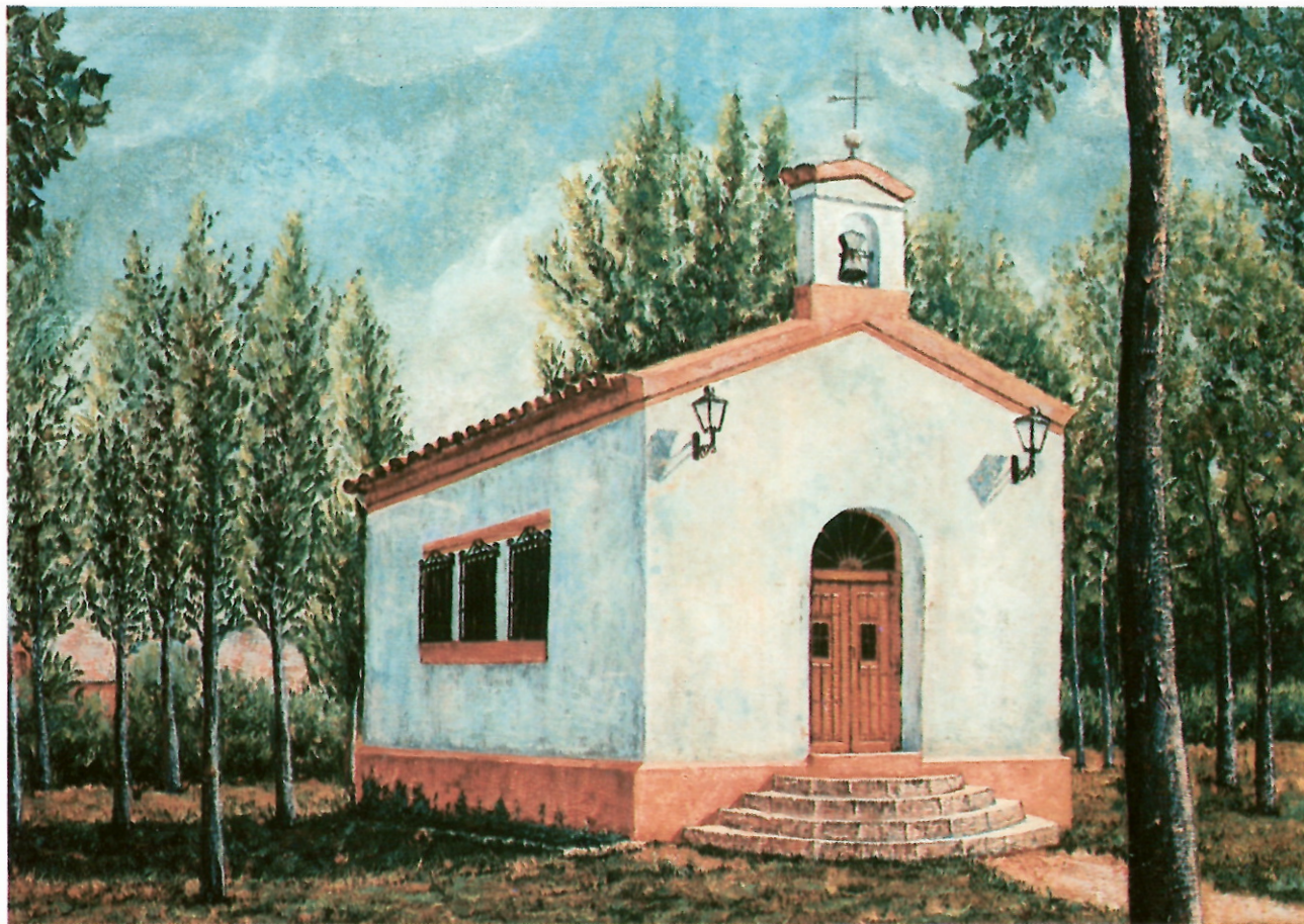
ERMITA DE SAN ROQUE