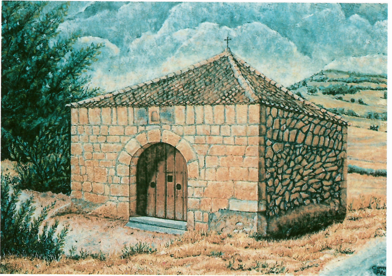
ERMITA NUESTRA SEÑORA DE LA ZARZUELA