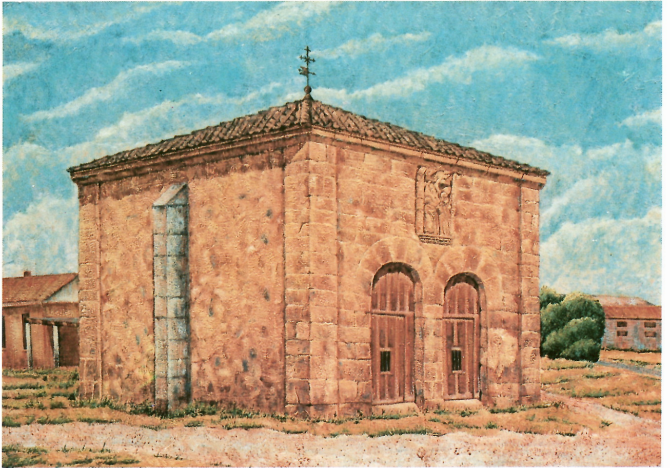
ERMITA DEL SANTO CRISTO