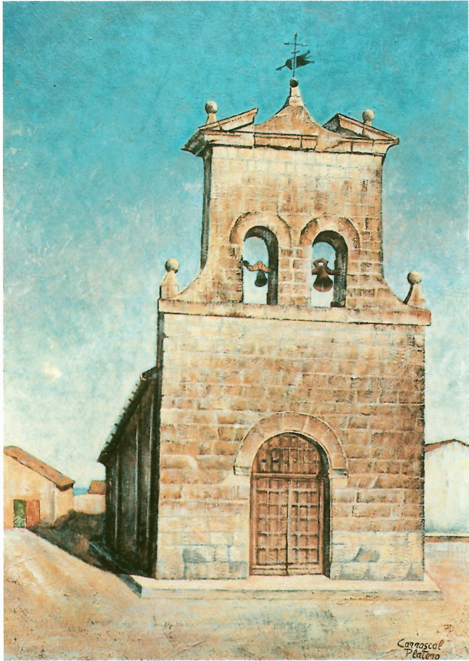
ERMITA SANTA MARIA DE LA ESTRELLA