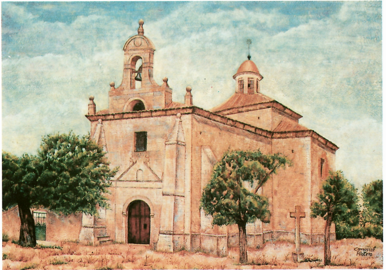
ERMITA NUESTRA SEÑORA DE RUBIALEJOS