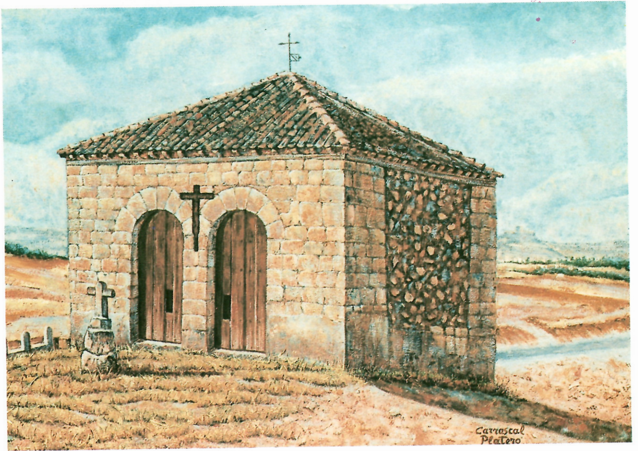
ERMITA DEL CRISTO