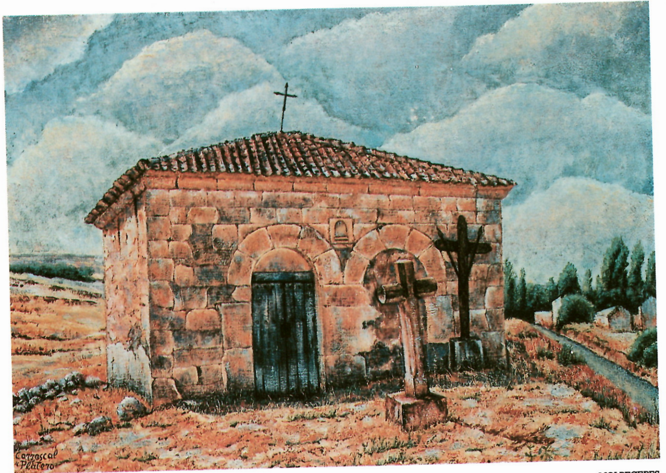
ERMITA DEL CRISTO