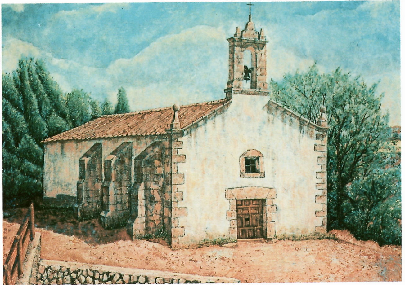
ERMITA NUESTRA SEÑORA DEL OLMAR