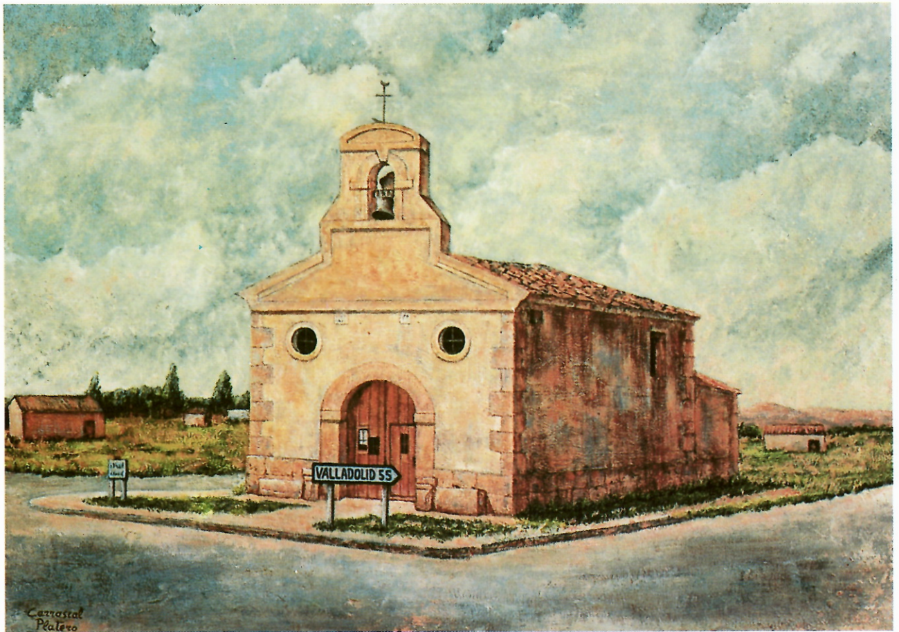
ERMITA DEL SANTO CRISTO