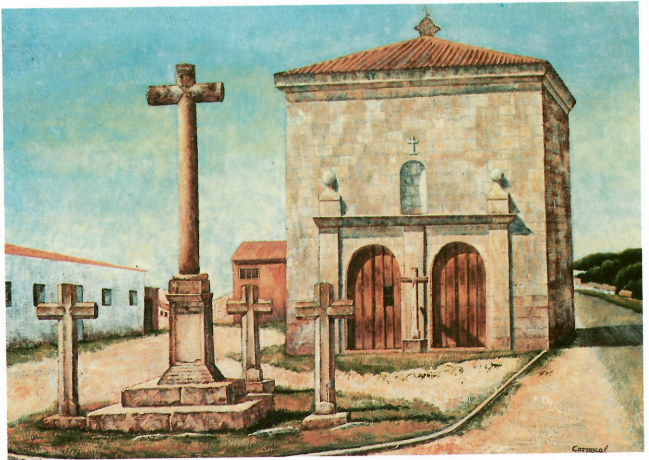
ERMITA DE SAN ROQUE