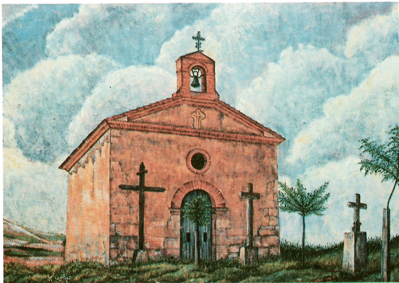
ERMITA DEL CRISTO