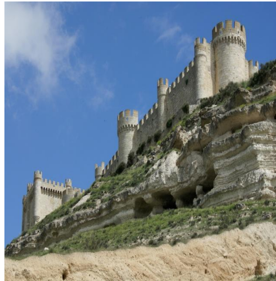
CASTILLO DE PEÑAFIEL BELLEZA GIGANTE