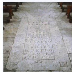
Losa de la Iglesia de las Claras