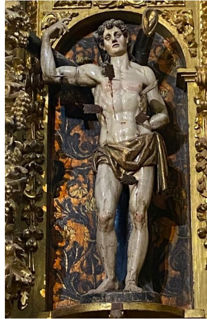
Talla de San Sebastián. Fotografía de Enrique García García

Francisco estaba vecinado en Peñafiel y se autodenominaba entallador. Fue el autor de otras obras locales hoy desaparecidas como el banco del retablo mayor de la iglesia de La Pintada.